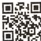
Obr. 4 QR kód – jednoduchý prístup na web stránku Rodinných poradní na Slovensku

Rodinné poradne možno kontaktovať osobne, telefonicky alebo emailom. Kontakty sú rovnako k dispozícii na www.rodinnaporadna.sk (obr. 4).