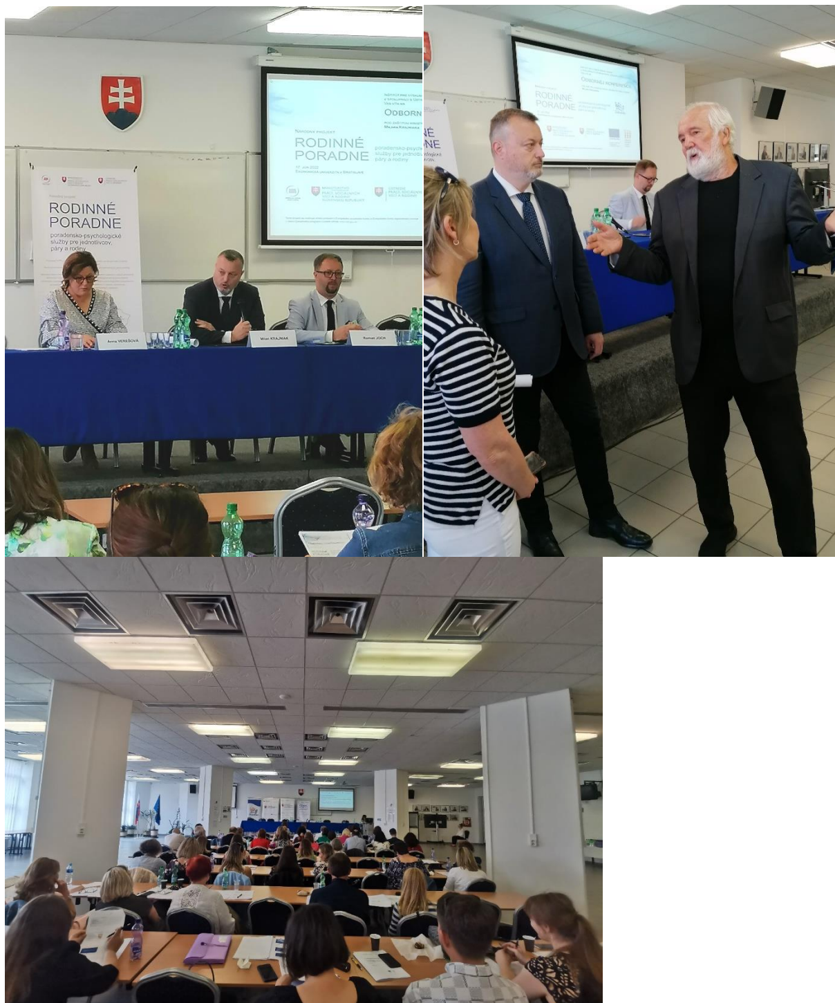
Odborná konferencia NP Rodinné poradne, 17. 06. 2022

https://ivpr.gov.sk/wpcontent/uploads/2022/05/pozvanka_na_odbornu_konf_np_rop_o.pdf .