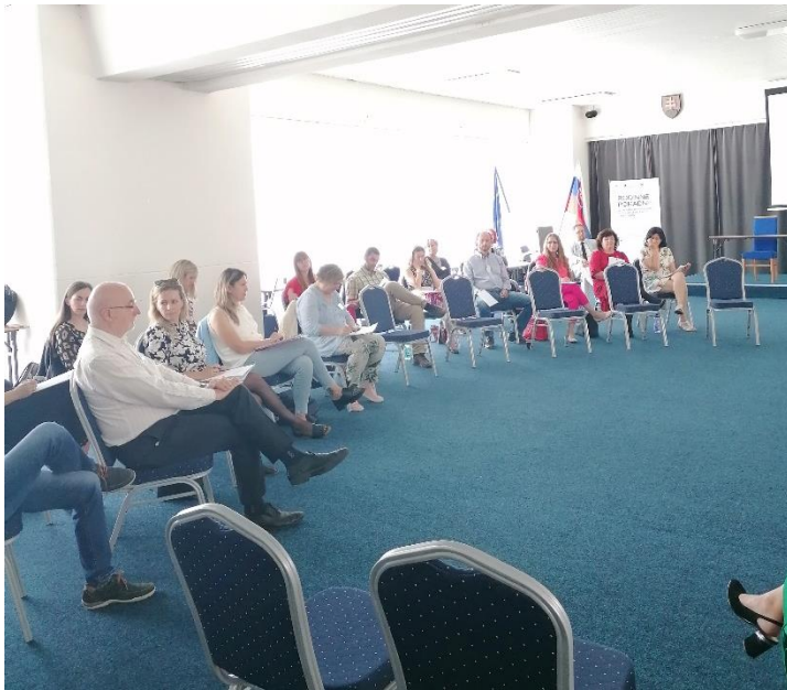
Workshop 17. 06. 2022 – interná komunita NP Rodinné poradne

Ako sme už uviedli vyššie v texte, dňa 02. 06. 2022 boli slávnostne otvorené rodinné poradne na Slovensku – návštevou (11.00 hod.) a tlačovou konferenciou (11.30 hod.) ministra práce, sociálnych vecí a rodiny Milana Krajniaka v Rodinnej poradni v Trnave. Tlačová konferencia je zverejnená na: https://youtu.be/dpzjf2yNca4 .