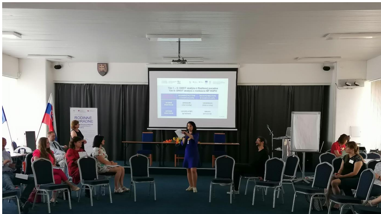
Workshop 17. 06. 2022 – aktivity pre internú komunitu NP Rodinné poradne

Odbornej časti konferencie sa zúčastnilo 69 účastníkov. Workshop ako súčasť odbornej konferencie bol realizovaný v popoludňajších hodinách pre internú komunitu národného projektu a zúčastnili sa ho zamestnankyne a zamestnanci 5-tich pilotných rodinných poradní, zástupcovia partnera - Ústredia PSVR, celý projektový tím u prijímateľa a analytický a expertný tím NP Rodinné poradne.