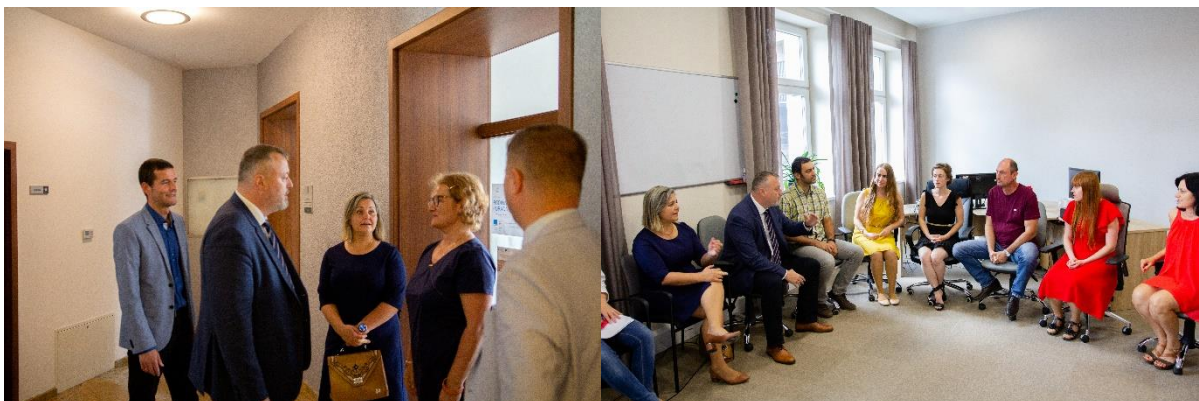
Návšteva ministra práce, sociálnych vecí a rodiny Milana Krajniaka v Rodinnej poradni v Žiline, 15. 07. 2022