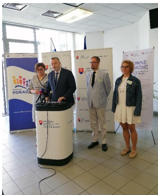
Tlačová konferencia 17.06.2022

Pred samotnou odbornou konferenciou sa uskutočnila tlačová konferencia: https://youtu.be/WU7E41k2114 .