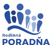
Logo Rodinnej poradne NP Rodinné poradne

Dňa 12. 04. 2022 bola z tlačového odboru MPSVR SR zaslaná informácia o schválenom logu Rodinnej poradne, ktoré sa používa na podujatiach, prezentačných materiáloch (letáky a iné aj vo farebnej verzii). Zároveň bol vypracovaný aj dizajn manuál k logu ROPO.