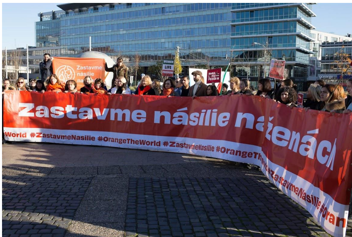
Verejné zhromaždenie Zastavme násilie na ženách/ Orange the world na Hodžovom námestí v Bratislave s podporou prezidentky SR Zuzany Čaputovej, november 2022

webstránke www.totojerovnost.eu . Počas celého roka 2022 boli pravidelne uverejňované aktuálne informácie o výstupoch NP PERD a zdieľané informácie o postavení žien a dievčat na 7 stránkach, ktoré projekt spravuje na sociálnych sieťach (Koordinačno-metodické centrum pre prevenciu násilia na FB, Toto je rovnosť na FB a Instagrame, Storočie voľby na FB a Instagrame, Zastavme násilie na FB a Linka pre ženy na FB a Instagrame).