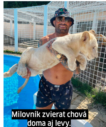
Milovník zvierat chová doma aj levy.