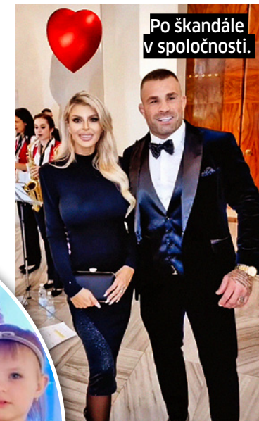
Po škandále v spoločnosti.