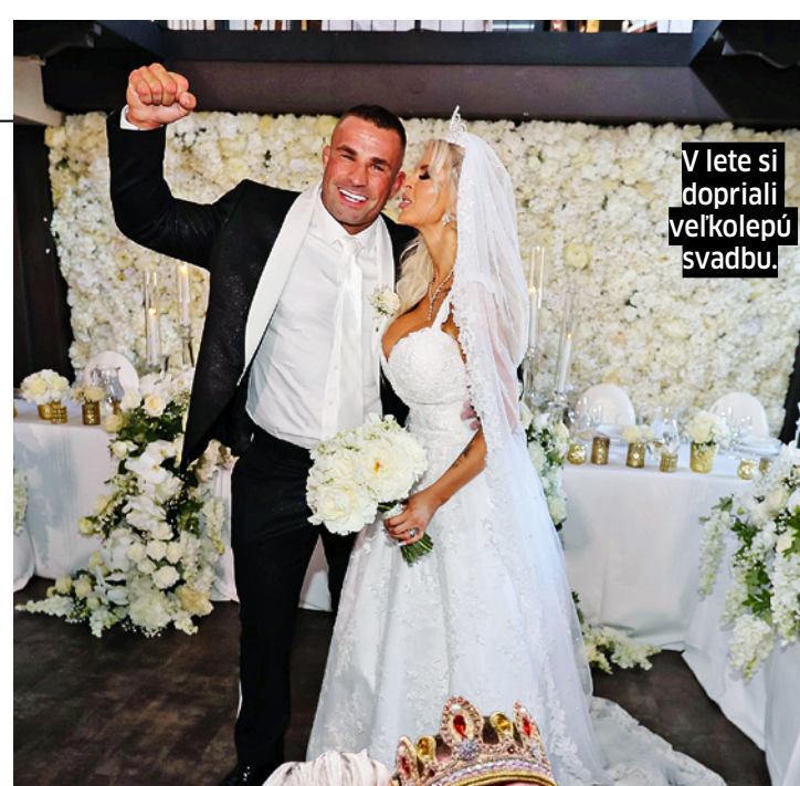
V lete si dopriali veľkolepú svadbu.